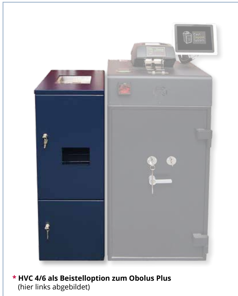
* HVC 4/6 als Beistelloption zum Obolus Plus (hier links abgebildet)

Sie zahlen Kasseneinnahmen ein. Der Tresor sichert, zahlt und bucht.